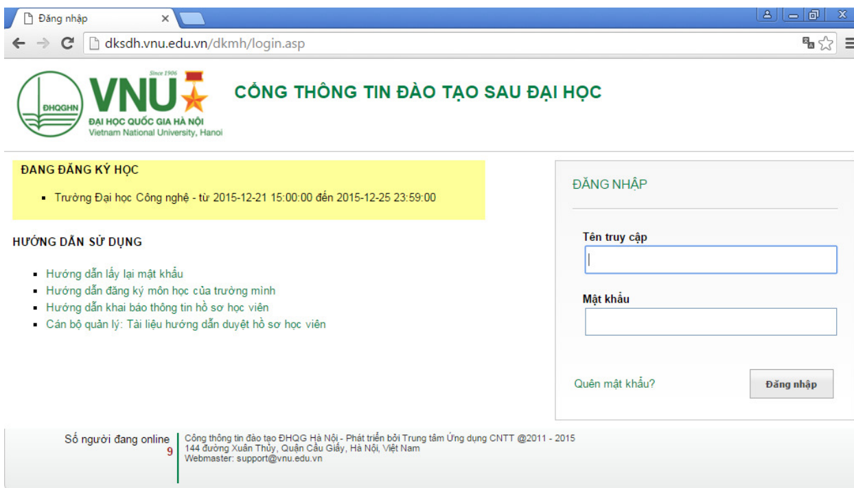
Hình 2: Giao diện đăng nhập của hệ thống

Người học đăng nhập vào hệ thống để đăng ký môn học bằng cách nhập tên người dùng và mật khẩu vào khung “đăng nhập hệ thống”, sau đó nhấn nút “ Enter ” (hoặc click vào nút “ Đăng nhập ”)